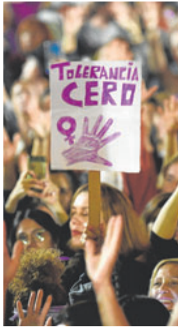
Manifestación del 25N. c7

A esto se suma «el mito de la perversidad y la maldad de las