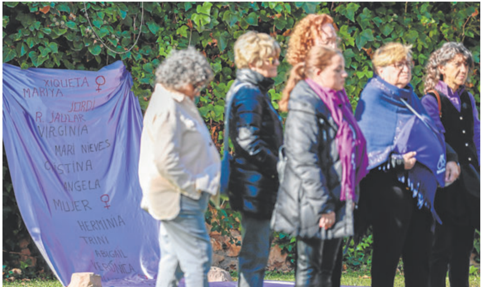
Acto de homenaje en Valencia a las mujeres asesinadas por el terrorismo machista.

Pese a ello, Díaz considera que el problema va más allá y que si