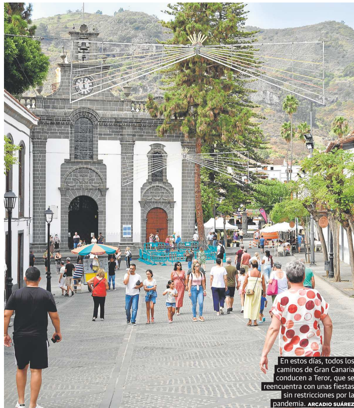
En estos días, todos los caminos de Gran Canaria conducen a Teror, que se reencuentra con unas fiestas sin restricciones por la pandemia.

Como en años anteriores, la Basílica estará cerrada en la noche de este 8 de septiembre, desde las 12 de la noche a las 5 de la madrugada. Durante estas horas, la imagen de Ntra. Sra. del Pino, permanecerá en el atrio de la Basílica acogiendo a todos los peregrinos que se acerquen a Teror. Como es ya tradición, la talla