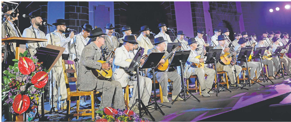
Un pregón lleno de música, sentimiento y recuerdos marcó el inicio de las fiestas. COBER

Nuestra madre amada se convierte en estas fechas en polo de atracción de peregrinos, que con fe y alegría se desplazan al en-