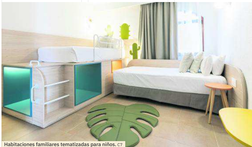
Habitaciones familiares tematizadas para niños. C7

En los últimos años, la cadena ha reformado sus hoteles, renovando la marca y segmentando los activos según la tipología de cliente dejando los hoteles, HD Parque Cristóbal Gran Canaria y HD Parque Cristóbal Tenerife, dentro de la propuesta «Family & Joy». En ambos hoteles, las familias encontrarán muchas posibilidades diferentes de habitaciones tematizadas, de ocio y actividades muy variadas e innovadoras, donde todos los miembros de la familia pueden disfrutar juntos, sin renunciar al ocio segmentado por edades.