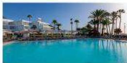
Hotel Riu Paraiso Lanzarote ****

Promoción sujeta a disponibilidad. Consulte las condiciones en riu.com