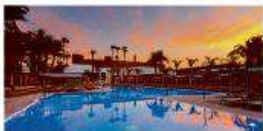
Hotel Riu Palace Oasis