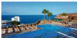
Hotel Riu Vistamar ****