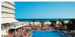
Hotel Riu Oliva Beach Resort ***

ALEMANIA · ARUBA · BAHAMAS · BULGARIA · CABO VERDE · COSTA RICA · EAU · EEUU · ESPAÑA · IRLANDA · JAMAICA · MALDIVAS · MARRUECOS · MAURICIO · MÉXICO · PANAMÁ · PORTUGAL · REPÚBLICA DOMINICANA · SENEGAL · SRI LANKA · TANZANIA