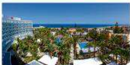
Hotel Riu Palace Palmeras