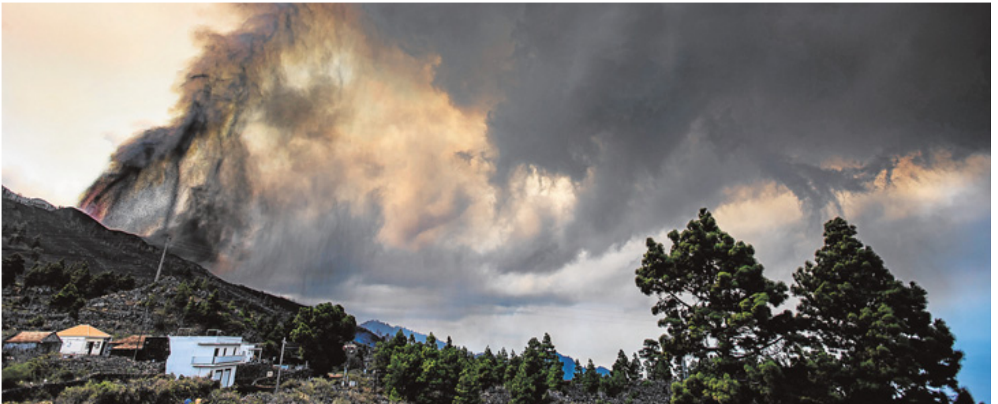
Columna de humo y ceniza procedente de la erupción.