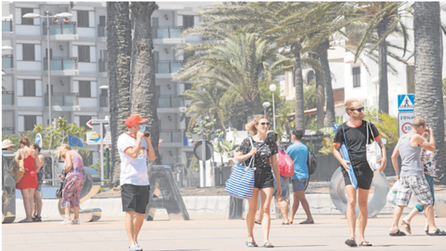
El retorno del turismo se deja notar en Canarias y las perspectivas mejoran ante el fin de las restricciones para viajar. JUAN CARLOS ALONSO