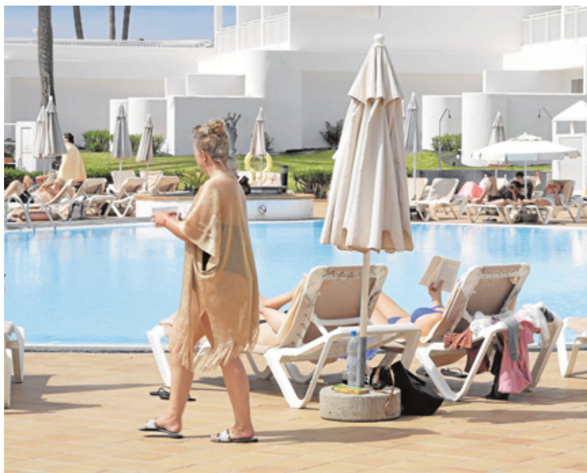
Turistas en un complejo alojativo de la isla de Lanzarote.

Los asalariados en el sector (el 79,2 % del total) se incrementaron un 5 % en agosto por la subida en servicios de restauración (3 %) y alojamiento (13,7 %). Las