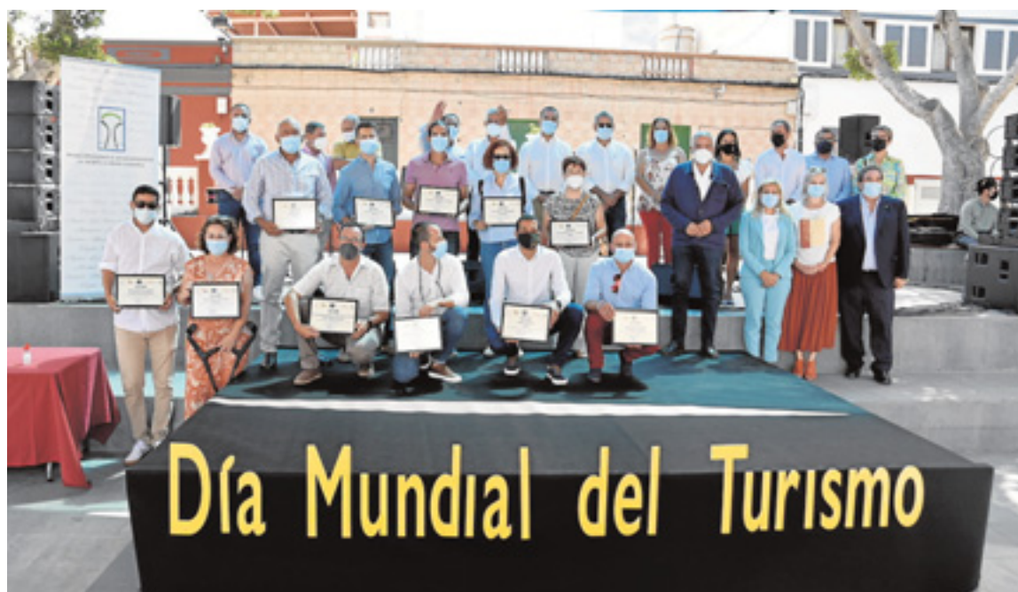
Foto de grupo ayer de los ganadores de los premios con los representantes institucionales. c7

* Alojamiento: Casa Rural Junquillo-Llanos de la Corona (Santa María de Guía) y Casa Rural El Ca-