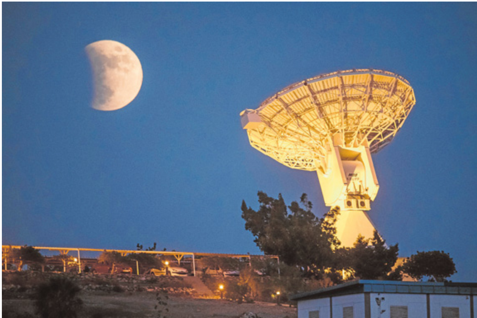
La Luna, con una de las antenas de la estación de Maspalomas en primer término. NACHO GONZÁLEZ ORAMAS

Japón trabaja en el desarrollo de un entorno institucional, científico y económico que permita el desarrollo de futuros proyectos comerciales en el espacio