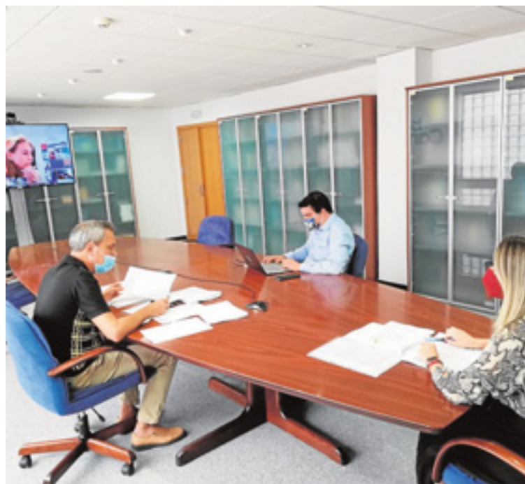
Reunión del jurado de los premios, cuya entrega se ha pospuesto por lo ocurrido en La Palma. c7

El pasado mes de junio, el jurado de estos galardones designó al colectivo Asociaciones Pro-