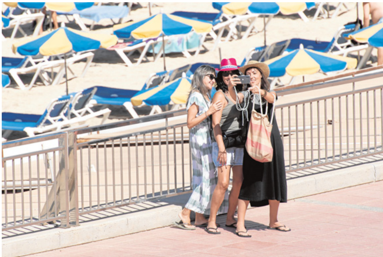
Gran Canaria recupera el turismo de manera progresiva. En la imagen, un selfi colectivo en Amadores. JUAN CARLOS ALONSO

Ha sido una temporada en la que el sector se ha sostenido gracias a que el consumidor nacional ha optado por quedarse pero