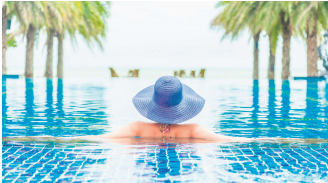
La placidez y la calma con la que se encuentran los turistas en las islas es un valor añadido. c7

Identificar estos perfiles es el primer paso para demostrarles que el Archipiélago tiene algo reservado para cada uno de ellos.