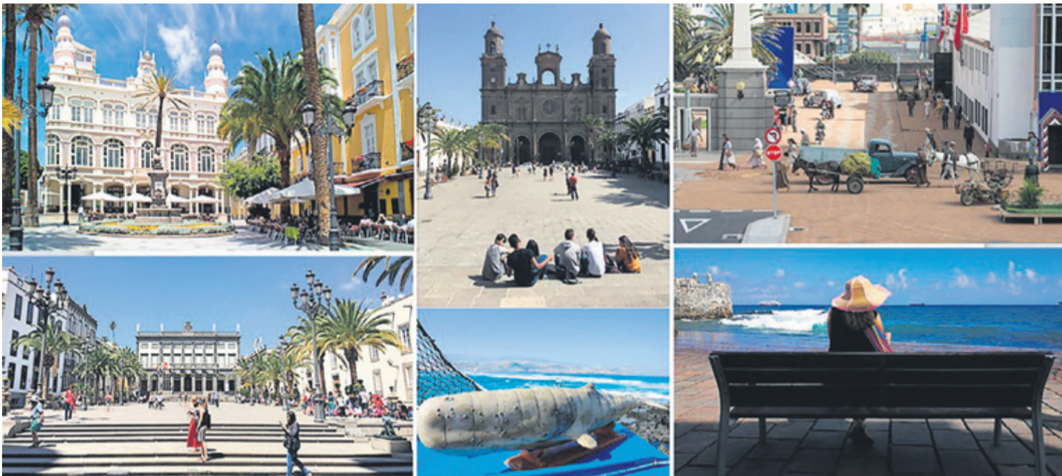
Muchos rincones de la ciudad de Las Palmas de Gran Canaria han sido escenarios de rodajes internacionales. c7