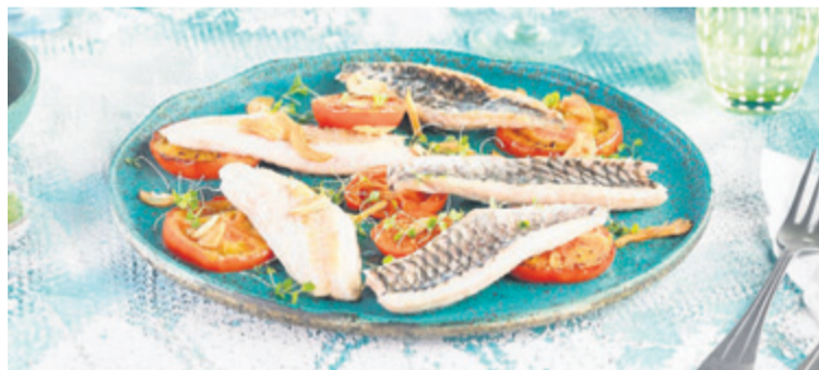
Pescados y postres autóctonos son muy apreciados. c7