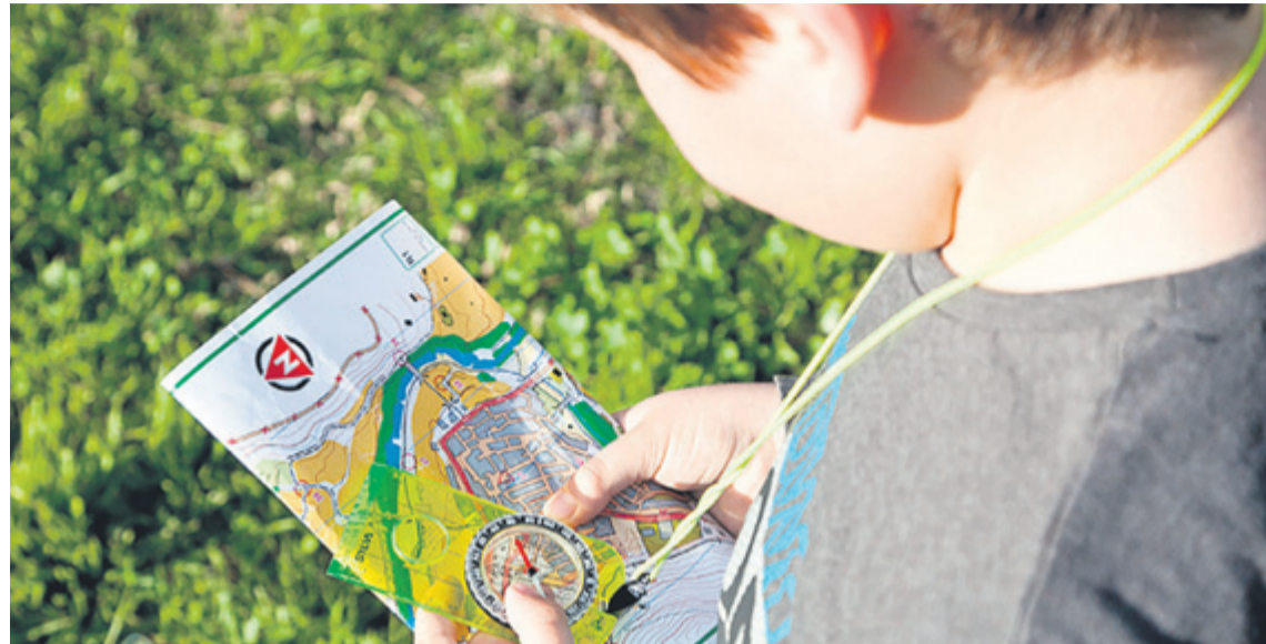
La orientación tiene un carácter lúdico que permite participar a los más jóvenes. c7

Los impresionantes paisajes de las islas, junto con la presen-