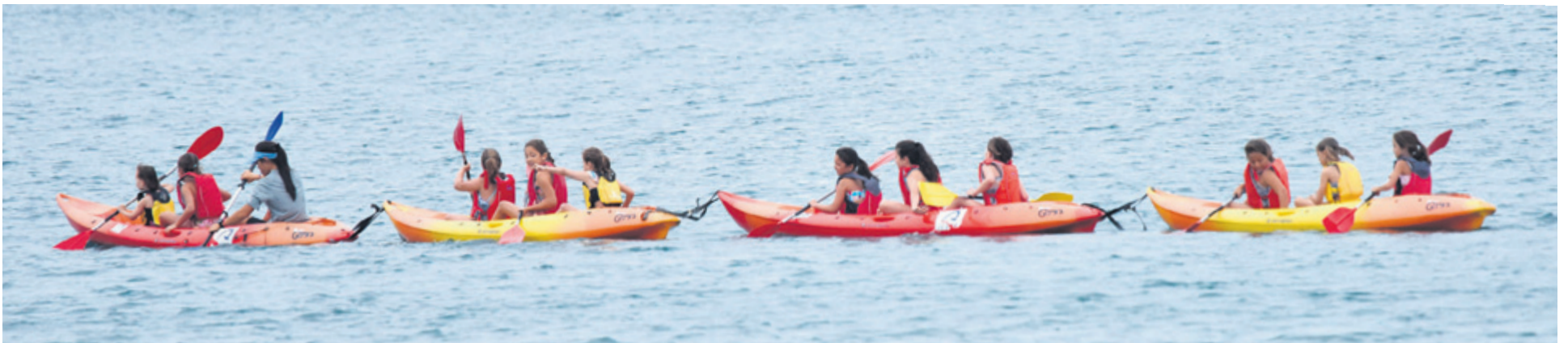
Las divertidas clases para aprender a maniobrar con el kayak atrae a muchos jóvenes, y mayores, a las escuelas de las Islas Canarias. c7