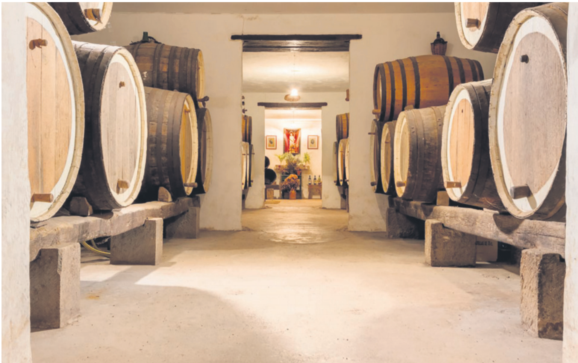
Cada vez más, la producción de las bodegas canarias encuentra su espacio en los locales de restauración y en los centros de venta alimenticios de Canarias. c7