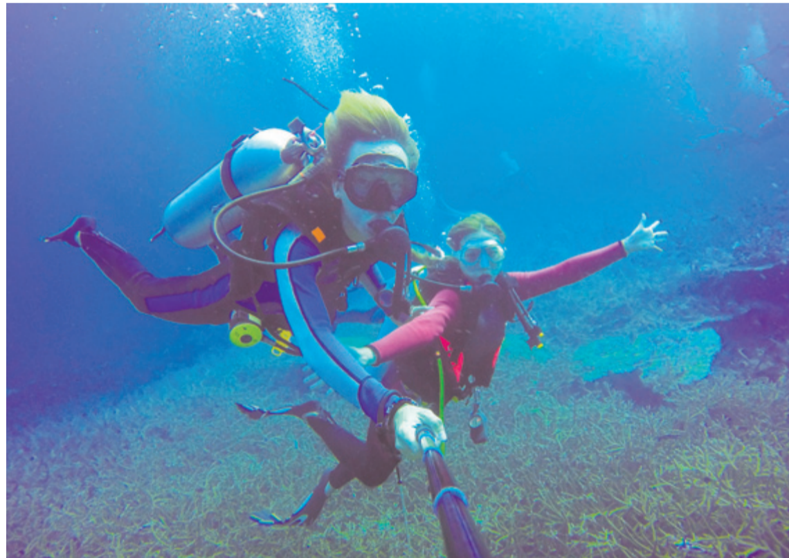
El buceo tiene mucha aceptación entre los turistas que visitan las islas. c7

El turismo activo y el ecoturismo se definen precisamente por la actitud ambientalmente responsable ante la naturaleza, protegiendo la integridad del ecosistema y fomentando la