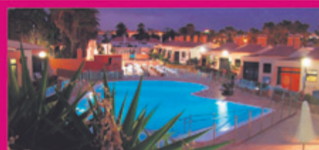
BUNGALOW CASTILLO PLAYA** Caleta de Fuste · Fuerteventura