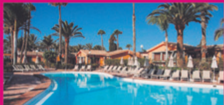
HOTEL MASPALOMAS RESORT by Dunas **** Maspalomas · Gran Canaria

«En mi descanso estival quiero aprovechar para desplazarme a Lanzarote y a Fuerteventura. Deseo aprovechar el tiempo para descansar, y disfrutar de su clima y de sus playas. Últimamente, también estoy profundizando en la gastronomía de cada lugar porque me parece algo esencial. Mis mejores recuerdos de los viajes que he realizado se dan en Corralejo. Me encantan sus playas paradisíacas. Es un lugar perfecto para desconectar.»