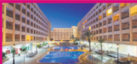
APARTHOTEL KN COLUMBUS*** Playa de las Américas · Tenerife