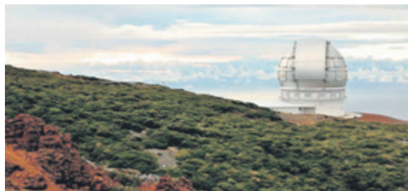
El Roque de Los Muchachos, una visita al zoológico de Loro Parque o poder ver de cerca a los cetáceos, experiencias inolvidables. C7