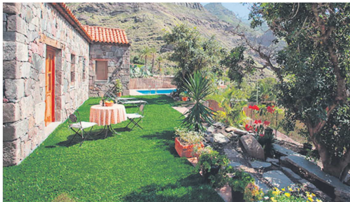
Esta espectacular se encuentra en Tamadaba, en la isla de Gran Canaria. c7

Yes que decantarse por hacer turismo rural en las islas será una experiencia única, podrán elegir alojarse en una de las casas rurales u hoteles rurales, edificaciones con historia donde conservan todo el sabor de antaño pero con el máximo detalle para generar un ambiente muy