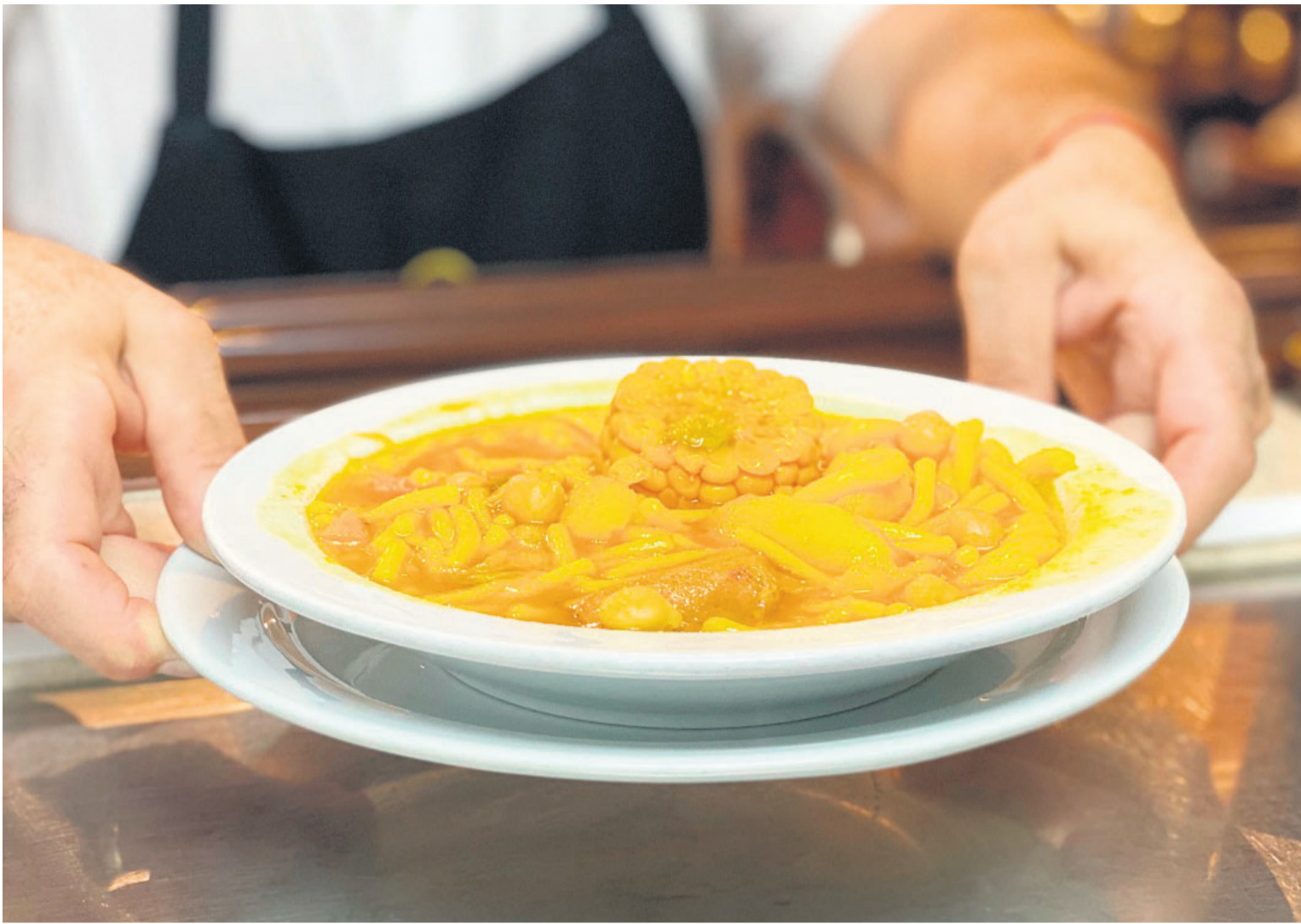
El Archipiélago canario tiene merecida fama de ofrecer suculentos platos basados en sus productos autóctonos. c7