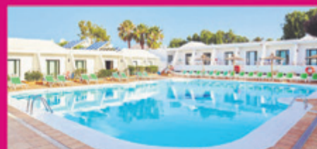
HOTEL THB FLORA*** Puerto del Carmen · Lanzarote