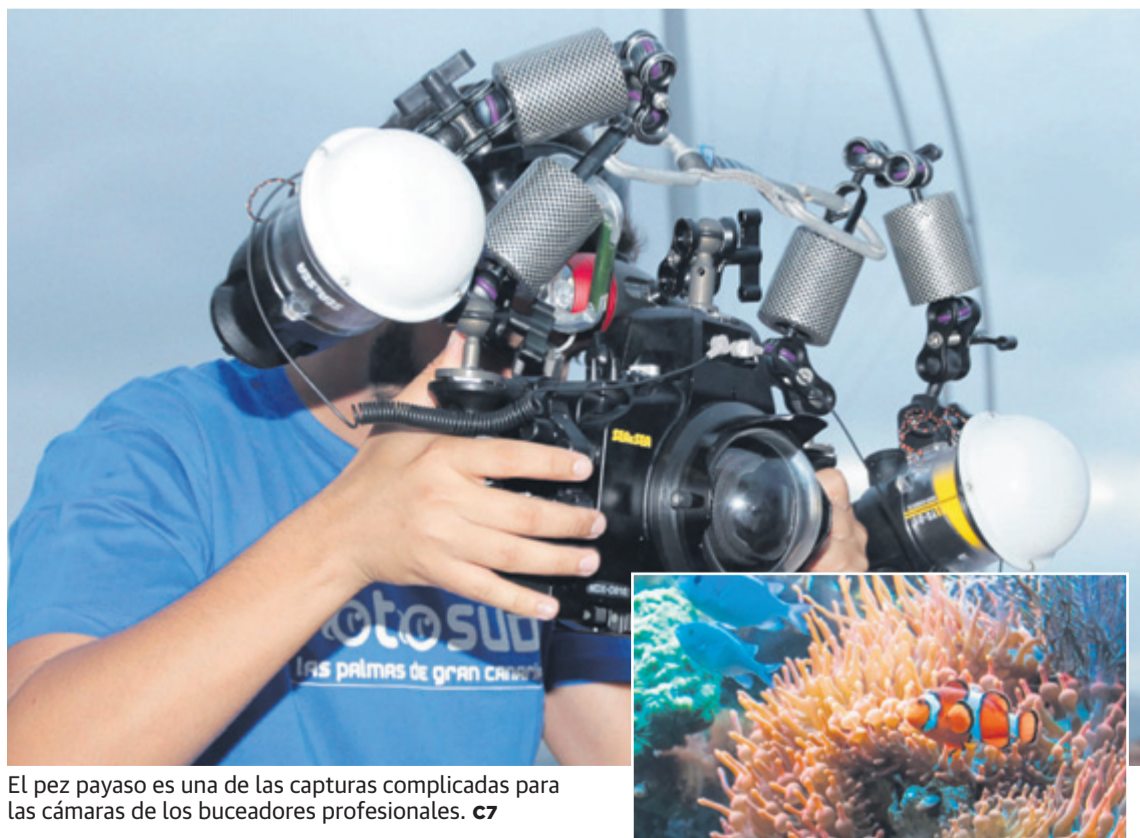
El pez payaso es una de las capturas complicadas para las cámaras de los buceadores profesionales. c7

La Reserva Marina de La Palma es la de más reciente creación, en 2001. Se sitúa en la costa suroccidental, entre la Caleta de los Pájaros y Punta Gruesa. Su superficie abarca 3.71 hectáreas y los fondos alcanzan profundidades que llegan hasta 1.000 metros. Estos son de naturaleza volcánica, abruptos y con grietas, cuevas y túneles. Todos un paraíso para los aficionados al buceo.