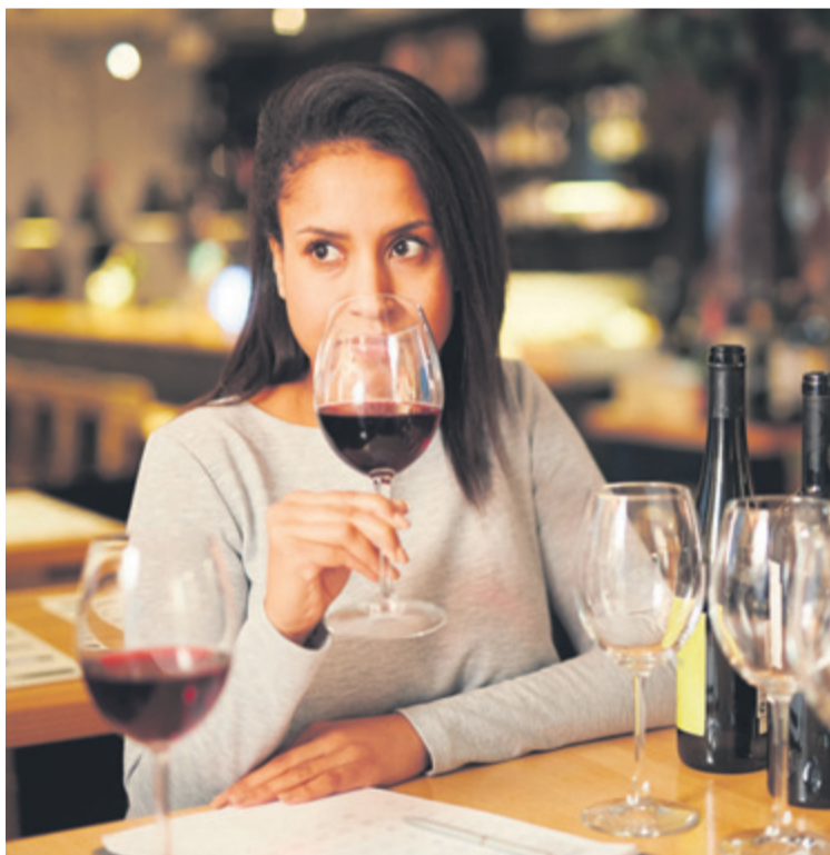
Dicen que apreciar el sabor de un vino tiene parte de ciencia y de arte. c7

Si se amplía un poco la ruta hacia el Oeste también depara al visitante un recorrido por el interior de la Isla con un sabor más tradicional y donde el turismo rural y enológico cobra un papel protagonista en el recorrido. Los municipios que abarca son Santa Lucía de Tirajana, San Barto-