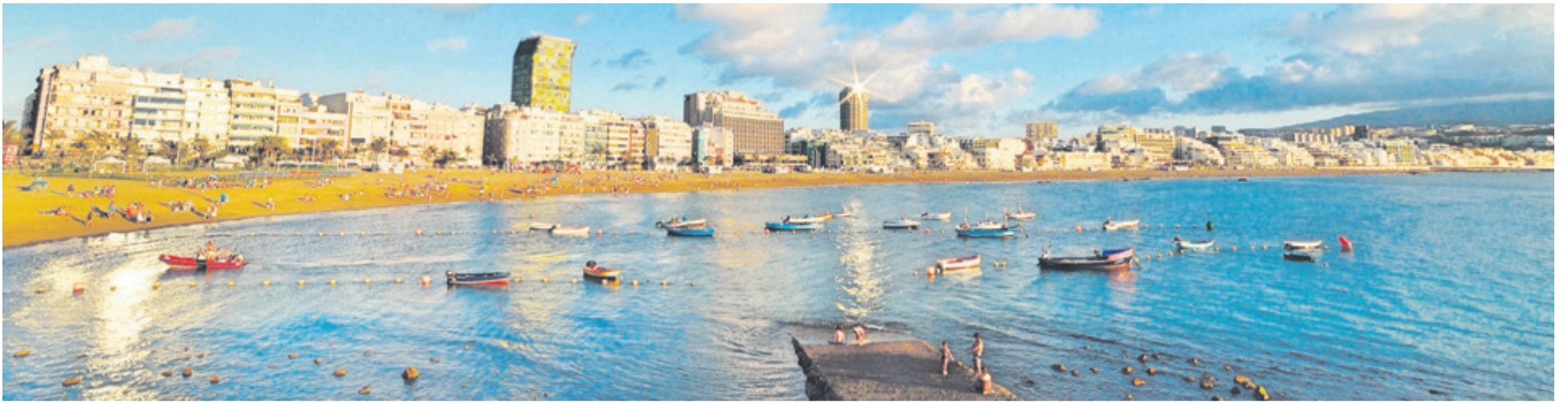
La majestuosa playa de Las Canteras, emblema de la isla de Gran Canaria.

Las Palmas de Gran Canaria es considerada como «un destino urbano aún por descubrir»