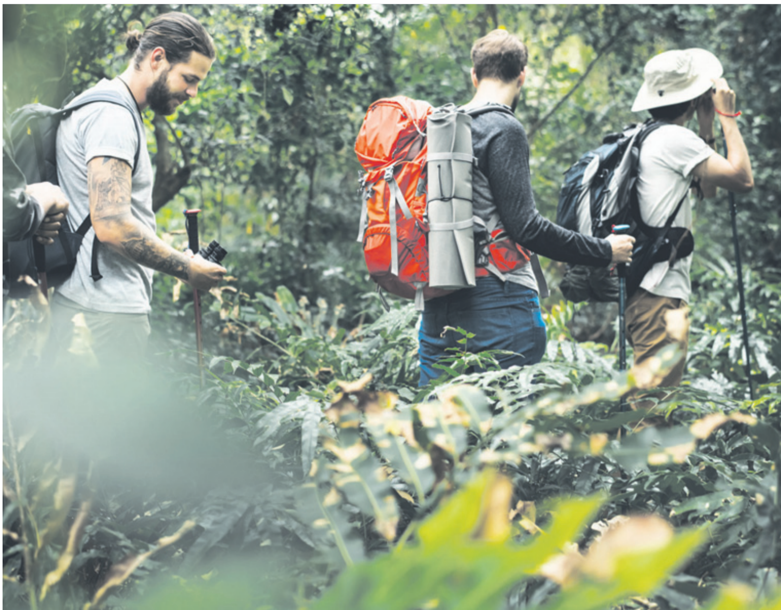
El senderismo o trekking cuenta con cientos de senderos de muy diversas características en las Islas Canarias. c7