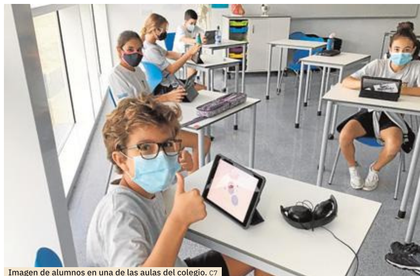
Imagen de alumnos en una de las aulas del colegio. C7

Cuando hablamos de innovación puede que lo primero que se nos venga a la mente sean las nuevas tecnologías y los aparatos electrónicos. Nada más lejos de la realidad, de hecho, nuestra política de cero tecnología hasta los 3 años no impide que el proyecto de esta etapa sea de los más punteros e innovadores del sector educativo. Sin