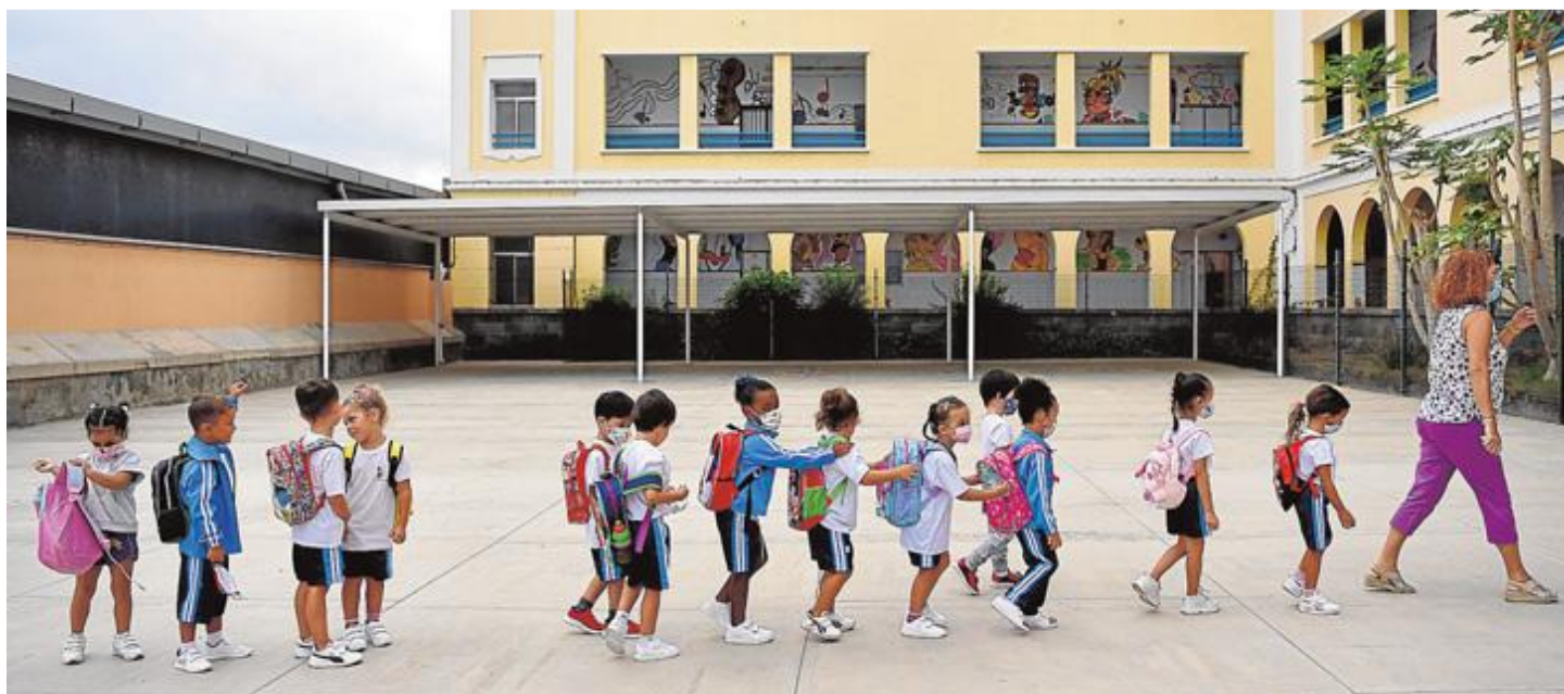
La covid-19 trastocó todos los planes educativos y obligó a estrictos protocolos. JUAN CARLOS ALONSO