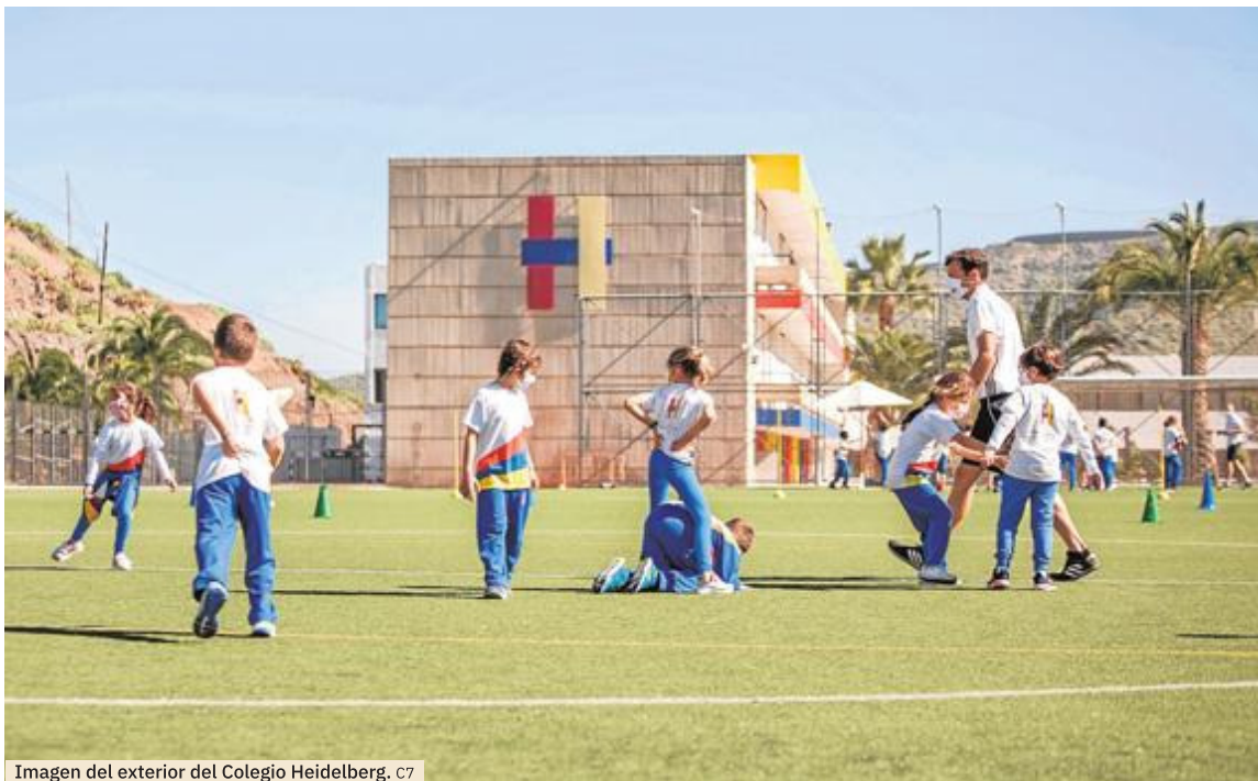
Imagen del exterior del Colegio Heidelberg. C7

Afrontan el desafío del aprendizaje de los idiomas como una inmersión en la lengua, favoreciendo el aprendizaje de forma natural y sin esfuerzo. Cuenta un proyecto trilingüe real y efectivo que permite a los alumnos alcanzar un nivel C1 tanto en inglés como en alemán. Comienzan con la enseñanza de alemán a los 2 años y a partir de los 5 incorporan el estudio del inglés, lo que les lleva a obtener las mejores calificaciones en la EBAU y certificar sus niveles de idiomas a tra-