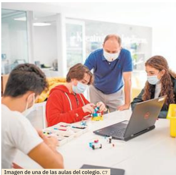
Imagen de una de las aulas del colegio. C7

vés los exámenes oficiales de Cambridge English, Goethe-Institut y Deutsches Sprachdiplom der KMK.