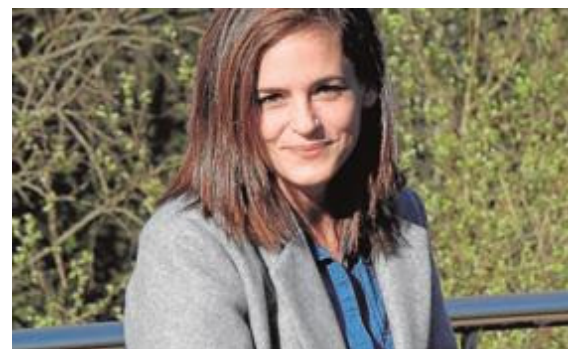
La fundadora de Educa Bonito.

Por ello aconseja priorizar las necesidades humanas, proponer modelos que fomenten la cooperación y que dejen de basarse en puntuaciones que limitan la creatividad y la curiosidad infantil, para