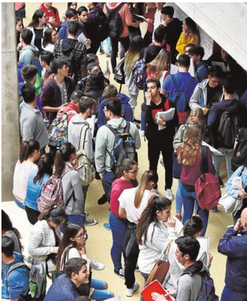
Imagen de archivo de alumnos ante una prueba de acceso universitario en la capital gran Canaria.

En la mayoría de los casos, explica, prevaleció el criterio de los rectores de que su distribución fuera acorde al peso de cada Universidad (número de alumnos y profesores).